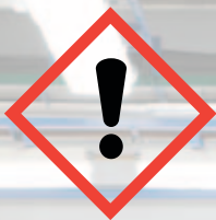
GHS07: Exclamation mark