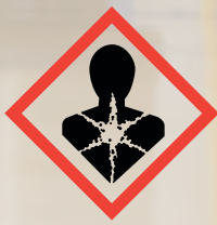
GHS08: Health hazard

Mai există și alte noi simboluri, dar care nu sunt relevante pentru detergenți și produsele de curățat