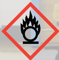
GHS03: Flame over circle