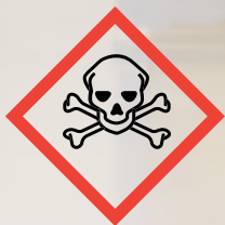
GHS06: Skull and crossbones