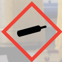
GHS04: Gas cylinder